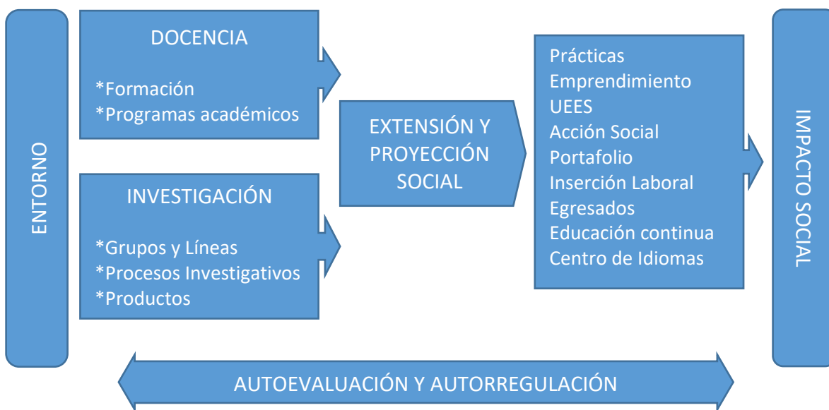
Gráfica 1: Modelo de Extensión y Proyección Social de UNISABANETA

Para el logro de lo anterior se hará una gestión progresiva y flexible, que se pueda ajustar en la medida de su desarrollo y con base en los resultados de la autoevaluación y autorregulación de la misma, que el mismo tiempo se oriente a la eficiencia y eficacia de las acciones a ser implementadas y que involucren el compromiso de toda la comunidad académica. En este sentido el Modelo de Extensión y Proyección Social de UNISABANETA se representa en la Gráfica No. 1: